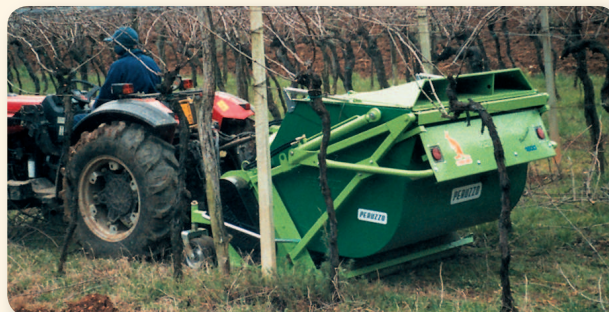
Triturazione di potature nei vigneti o frutteti con raccolta. Pruning shredding and collection on vineyards and orchards. Broyage et ramassage de sarments de vigne et d'arbres fruitiers. Mulchen und Aufnehmen von Schnittgut in z.B. Weinbergen und Obstgärten.