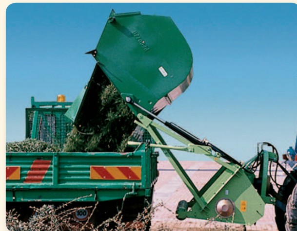
Scarico idraulico fino a 2 mt di altezza tramite il sollevatore del trattore. Hydraulic high tip discharge up to 2 mt. by means of tractor lift. Bennage hydraulique du coffre de ramassage jusqu'à 2 m de hauteur avec l'aide du relevage du tracteur. Hydraulischen Kippvorrichtung des Behälters, der mit Hilfe des hydraulischen Hebwerke des Traktors bis zu 2 Meter hoch gekippt werden kann.