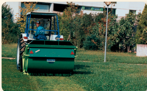
Buona qualità di taglio e raccolta su erba, per aree verdi. Good grass cut quality and collection on green areas Excellente qualité de coupe et de ramassage de l'herbe pour espaces verts. Sauberes Schnittbild – exzellente Aufnahme für Grünflächen

Diese Maschine ELEPHANT mit Hochentleerung ist für schwersten Einsatz und mit noch stärkerem Material als die Maschinen gebaut und wird zur Brachland-Pflege und Zerkleinerung von Heckschnitt und Büschen bis 5/8 cm Ø eingesetzt. Durch die Hochentleerung kann der Behälter direkt in Ladewagen oder LKW's entleert werden.