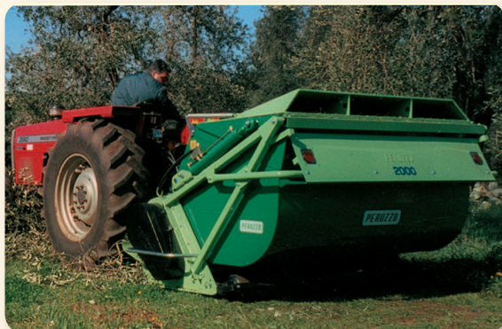
Triturazione e raccolta di potature negli oliveti. Pruning shredding and collection on olive trees fields. Broyage et ramassage de sarments d'oliviers. Mulchen und Aufnehmen von Schnittgut auf Olivenfeldern.